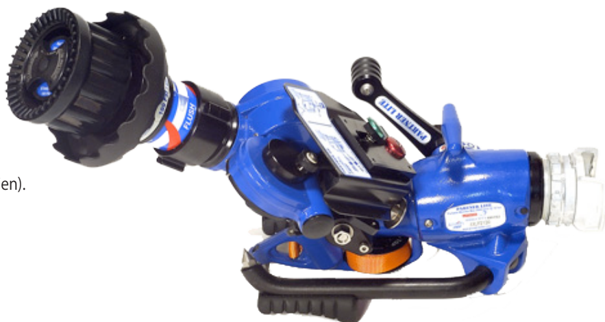
Partner lite oscillant