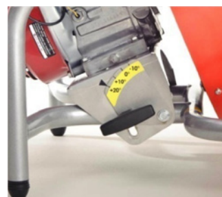
Manette pour ajuster l'angle d'inclinaison