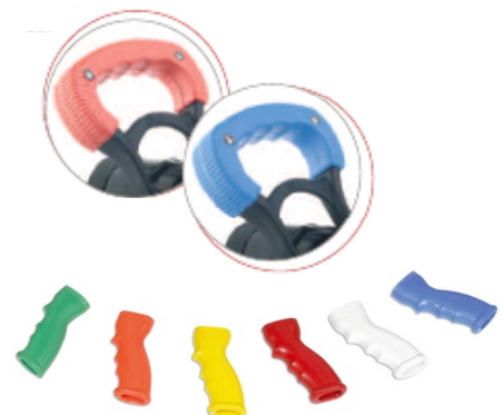
Poignées de couleur disponibles

LEADER Aujourd'hui les techniques du futur