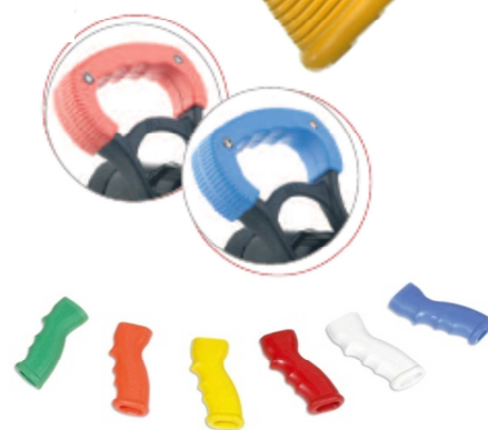
Poignées de couleur disponibles