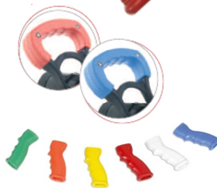
Poignées de couleur disponibles