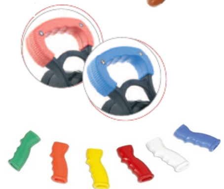
Poignées de couleur disponibles