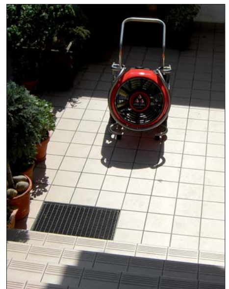
Angekippt: Der Easy Pow'air erreicht ca. 1,5 m vor der Treppe nahezu die gleiche Luftleistung als ohne Treppe.