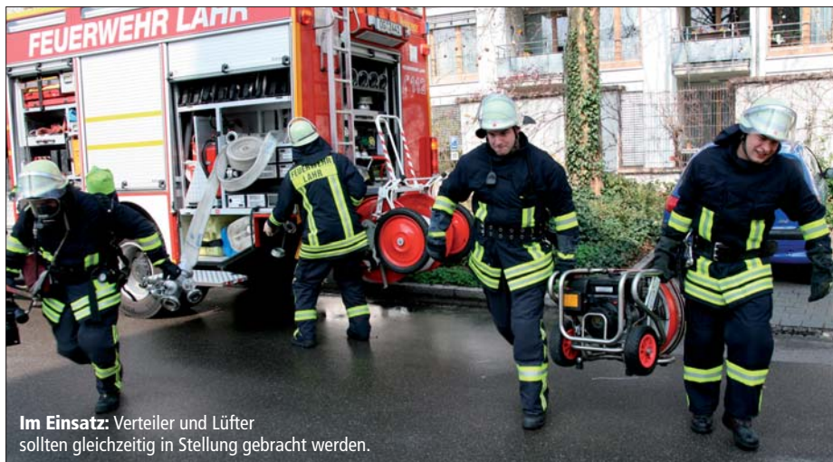
Im Einsatz: Verteiler und Lüfter sollten gleichzeitig in Stellung gebracht werden.