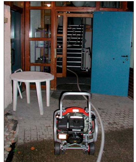
Zimmerbrand: Aufstellung des Easy I bei einem Realeinsatz.

Durch die serienmäßig neuen Eigenschaften wie Strömungsbild und automatische Neigungswinkeleinstellung vereinfacht die neue Technologie die Handhabung der Lüfertechnik. RW