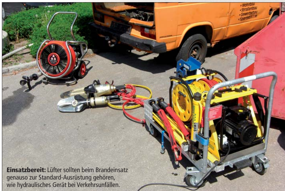
Einsatzbereit: Lüfter sollten beim Brandeinsatz genauso zur Standard-Ausrüstung gehören, wie hydraulisches Gerät bei Verkehrsunfällen.