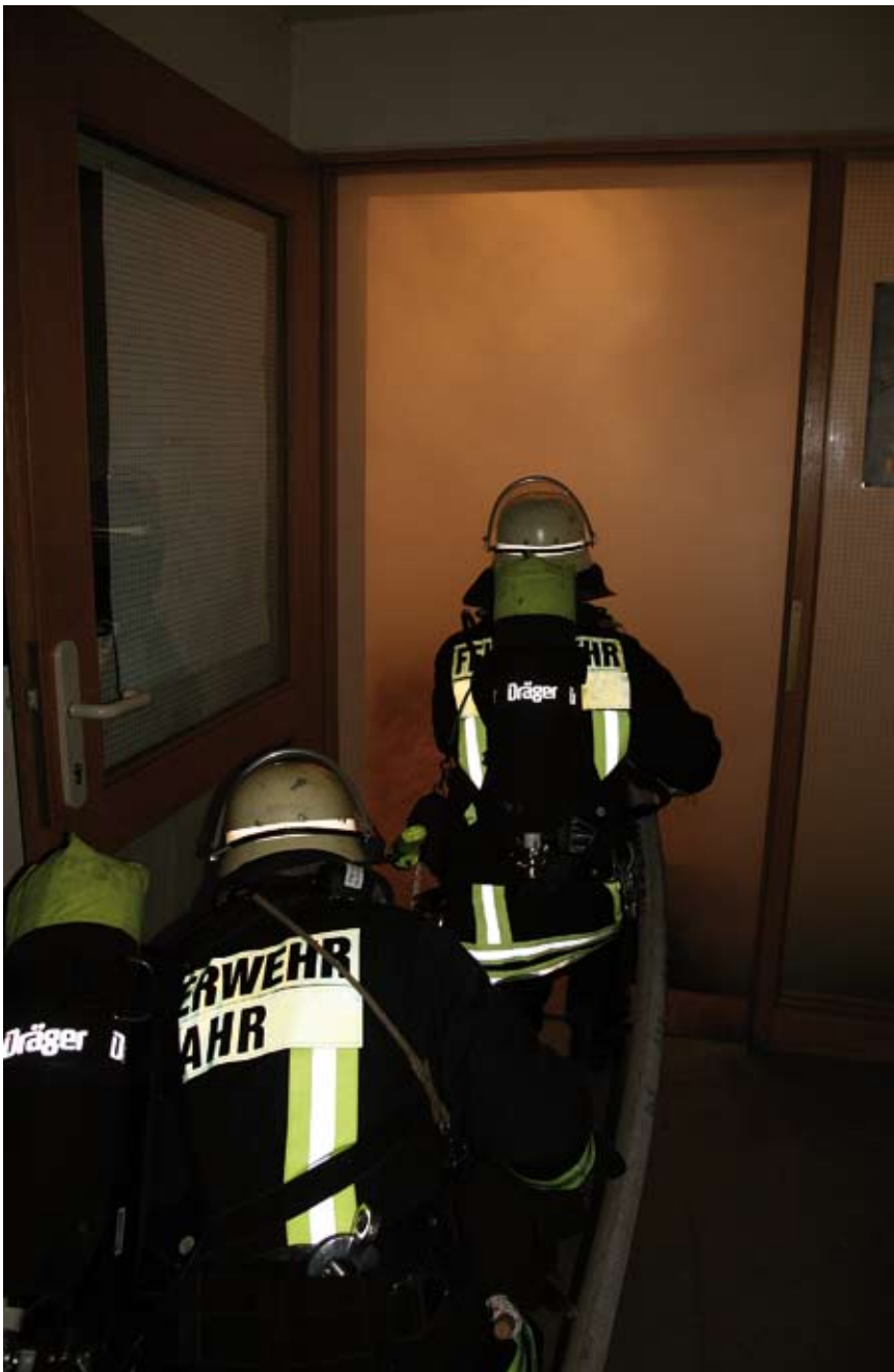
Nach dem Öffnen der Brandraumtür sollte der Angriffstrupp so schnell wie möglich in den Raum eindringen und eine Abluftöffnung schaffen (z. B. durch Öffnen von Fenstern in Nähe des Brandherdes).

Durch eine Optimierung des Einsatzablaufes und durch den korrekten Einsatz