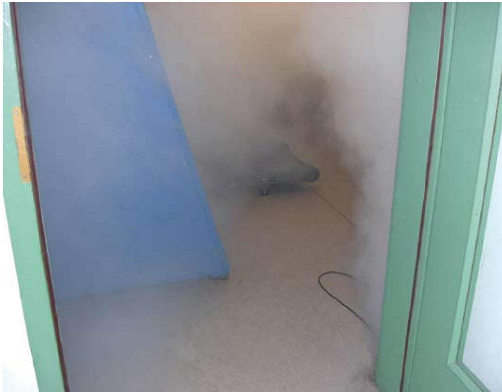
Beim Einsatz eines Turbolüfters wird die Raummitte zunächst deutlich stärker belüftet als die Randbereiche; es entsteht eine Art Schneise, wie auf diesem Bild deutlich zu erkennen ist. Ohne die Ablenkung durch die hier vorhandenen Gegenstände würde die Schneise geradeaus verlaufen.

Zum Stichwort »Treppenraumbelüftung« ist zu sagen, dass die Rauchmenge, wel-