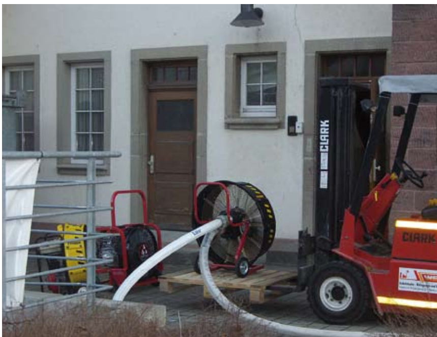
Getestet wurden sowohl Turbolüfter als auch klassische Überdruckbelüfter (links). Die Versuche zur Bestimmung der Druckerhöhung im Gebäudeinnern wurden anschließend auch noch mit speziellen Großlüftern (Bildmitte) zum Erhalt von Vergleichswerten durchgeführt, die wie die anderen Lüfter auf einer Ebene platziert vor der Eingangstür in Stellung gebracht wurden.

Der letzte und erheblich schwerwiegendere Faktor für eine schnellstmögliche »Rettungsbelüftung« ist die Abluftfläche, auch Austrittsöffnung genannt. In Lehrunterlagen wird bei der Anwendung der Überdruckbelüftungstaktik von einem Verhältnis zwischen Eintritts- und Austrittsöffnung (Zuluft- und Abluftöffnung) gesprochen. Dieses Verhältnis darf nach der Lehrmeinung nicht mehr als 1:1,5 betragen, da sonst Effektivitätseinbußen hinzunehmen seien. Im Standardfall mit einer Eintrittsöffnung von rund zwei Quadratmetern (Haustür) bedeutet dies, dass die Abluftöffnung höchstens eine Fläche von drei Quadratmetern haben darf. Diese, in Lehrunterlagen deutschlandweit verbreitete Lehrmeinung, wurde mithilfe eines Flügelrad-Anemometers überprüft. Mit diesem Messgerät können die Austrittsgeschwindigkeiten bei verschiedenen großen Abluftöffnungen gemessen werden. Im