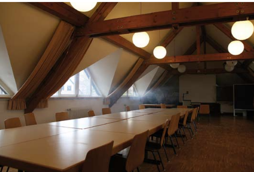
Blick in den zu belüftenden Versuchsraum (angenommener »Brandraum« mit rund 380 Kubikmetern Rauminhalt). Vorteilhaft war hier das Vorhandensein von mehreren Fenstern, wodurch die Größe der Austrittsöffnung schrittweise vergrößert werden konnte.

Bei optimaler Platzierung der Überdruckbelüfter mit kompletter Abdichtung der Eingangstür und einem daraus folgenden