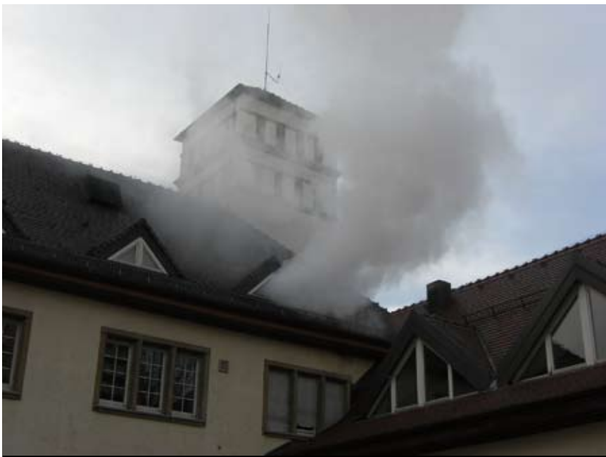
Im Rahmen einer Testreihe im Zeitraum von Dezember 2007 bis März 2008 wurde untersucht, unter welchen Voraussetzungen mit den bei den deutschen Feuerwehren am weitesten verbreiteten Lüfertypen ein optimales Ergebnis bei der Belüftung von Brandräumen erzielt werden kann. Das Bild zeigt den Rauchsstoß beim Einsatz eines Propellerlüfters bei einem dieser Versuche.

Als Alternative steht der Druckbelüftung die »Positive Pressure Ventilation« (Überdruckbelüftung) gegenüber. Bei dieser Belüftungstaktik wird mit bauartbedingt größeren Ventilatoren mit relativ wenig Blättern der Luftstrom erzeugt. Diese Blätter sind klassische Propeller, welche dank einer ausgeklügelten und stetig weiterentwickelten Technik einen gleichmäßigen Lufttrichter erzeugen. Die optimale Aufstellung dieser Geräte wird nach der herrschenden Meinung mit einem Abstand, der mindestens der Diagonalen der Eingangsöffnung entspricht, und dem Hinweis, dass die gesamte Oberfläche der