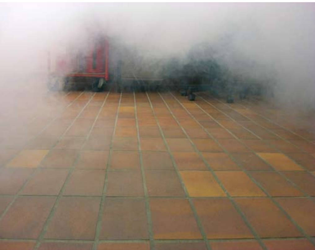
Allgemeine Beobachtung bei den Belüftungsversuchen: Der Nebel löste sich als erstes in Bodennähe auf.

Rahmen der Versuchsreihe wurden Abluftöffnungen mit einem Verhältnis zur Eintrittsöffnung von 1:0,9 bis 1:3,4 in sechs Stufen geschaffen. Durch die gemessenen Luftgeschwindigkeiten an der Austrittsöffnung konnte das jeweils austretende Luftvolumen berechnet werden.